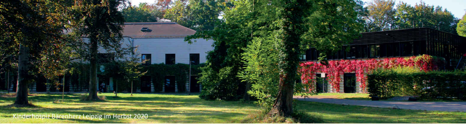
Kinderhospiz Bärenherz Leipzig im Herbst 2020